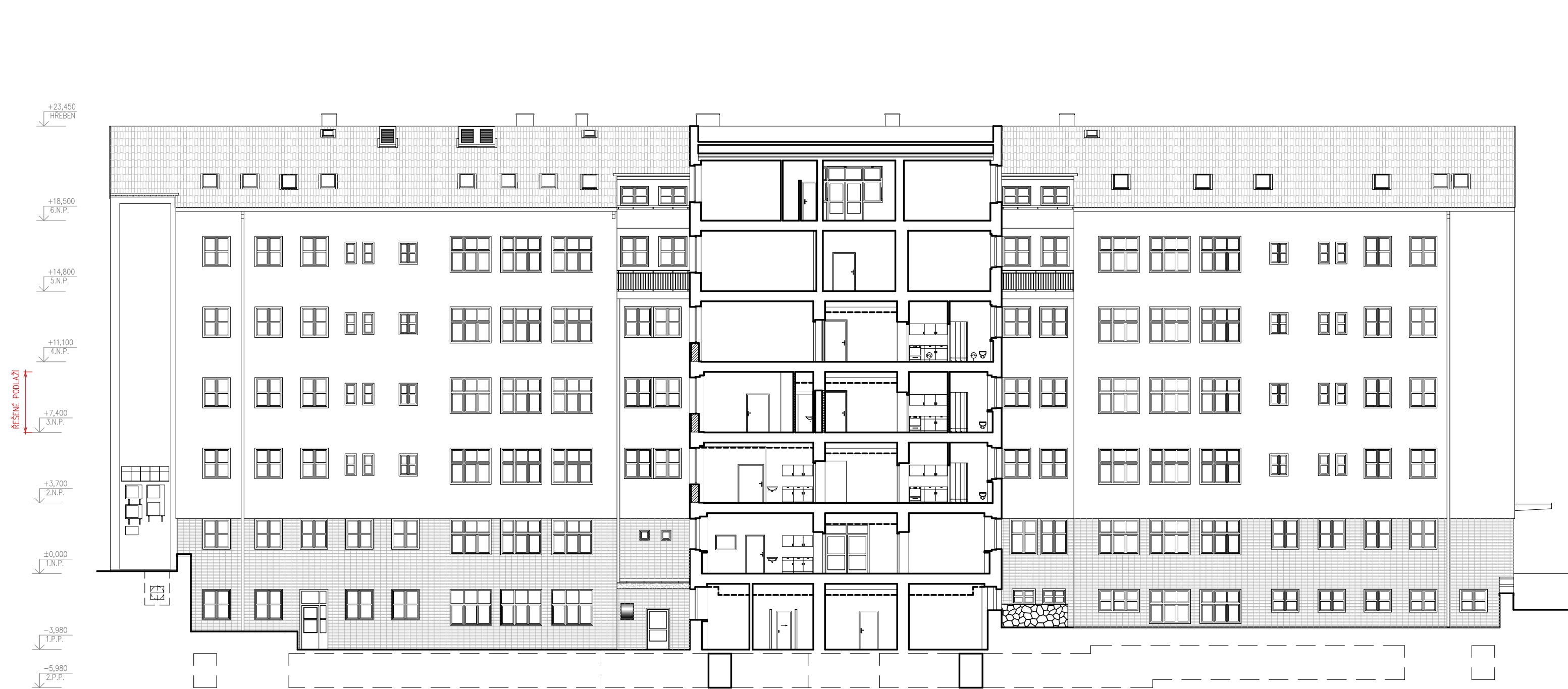
POHLED SEVERNÍ M 1 : 200